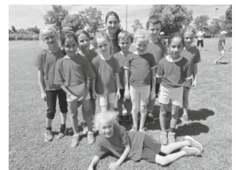
2. Platz für die U8