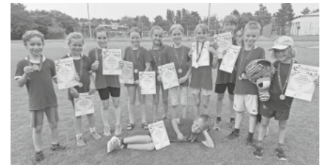
Erfolgreiches U10 Team: 11 Kinder mit Urkunde und Medaille.